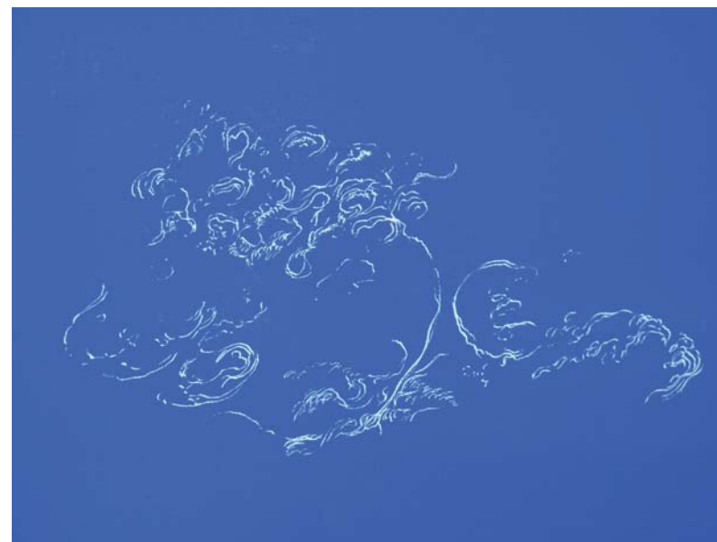
3 detalles de 10, 15 y 12 cm c/u de arabescos grabados a punta seca sobre el políptico de la Sala de Arte el Brocense (páginas 1, 21 y 22)