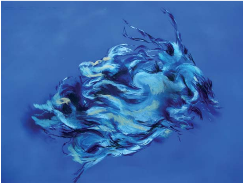
1000 olas 49 x 68 cm Pastel/papel 2009