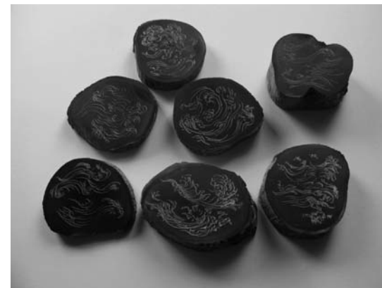
1000 olas 2009 7 matrices para frottage . Madera de olivo 2 - 3,5 x 6 - 8,5 cm Ø

Y ello lo muestran las obras en papel en las que pueden verse huellas de arabescos que, en esta ocasión, son olas de ausencia. La técnica para realizar estos dibujos es el frottage , creada por el dadaísta y posteriormente surrealista Max Ernst 18 , y utilizadas por muchos otros artistas (Masao Okabe) 19 . Las matrices que Talavero utiliza podrían considerarse piezas autónomas por su belleza, a pesar de ser meros instrumentos técnicos que funcionan como superficie de frotación: el artista ha cortado tallos de olivos, preparando su superficie, alisándola y oscureciéndola con tinta negra (siguiendo el proceso creativo de Rosetón del olivar ), para posteriormente grabar formas de corte japonés que se aproximan a olas en su morfología. Después, colocando un papel de escaso grosor sobre esta superficie, lleva a cabo la obra, deslizando el lápiz sobre el soporte. Nos detenemos en la explicación de la técnica del frottage porque adquiere una especial significación en el proyecto 1000 olas , e incluso en la comprensión poético-vital del propio artista. En el frottage Andrés desaparece, el sujeto desaparece, haciéndose inocencia, vaciándose de violencia. Se desaparece en el olivo para devenir, detrás de todo, ola, indicio de ola sugerida; se elude la metafísica de la presencia deviniendo huella, olivo-huella-ola, en la indeterminación de la forma