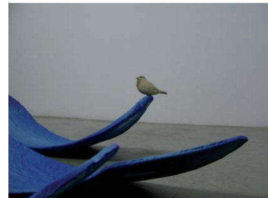
1000 olas Medidas variables comprendidas entre 3 - 5 m x 3 - 5 m x 20 cm Fibra de cemento y terracota Pájaro de terracota 10 x 6 x 12 cm 2005