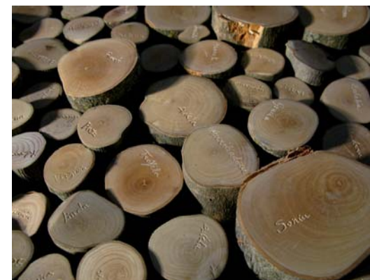
Rosetón del olivar 7 cm x 2 m Ø Madera de olivo grabada 2007