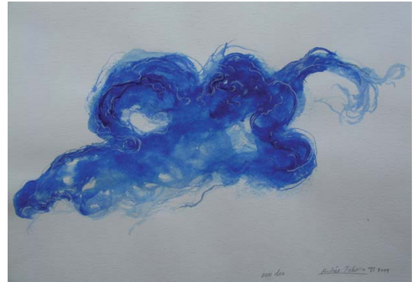
1000 olas 30 x 40 cm Acuarela y lápices de colores/papel 2009

Bajo el sol o en tinieblas sin luna ni gaviotas hasta la playa vuelve con su lengua de espuma errante o submarina que busca, blanca y lenta, la imagen de sí mismo. Y se encuentra, asombrado, a la vez la serena armonía del verde de sus aguas someras y el metálico azul de las penas mayores y del dolor adulto.