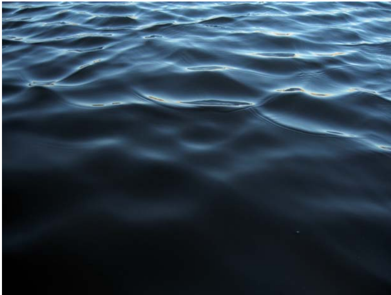
1000 olas Vídeo 8 minutos 2009

Por esta senda no hay nadie que camine: fines de otoño