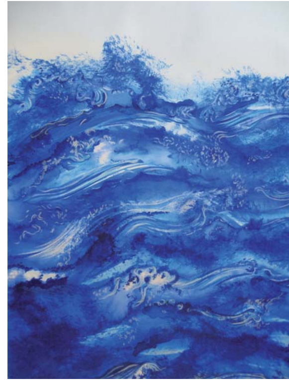
1000 olas 30 x 20 cm Acuarelas y lápices de colores/papel 2008

Con esta obstinación inútil de las olas que van y vienen, van y reiteradamente vuelven, tu corazón se rompe contra el acantilado alto de las estrellas calcáreas e impasibles.